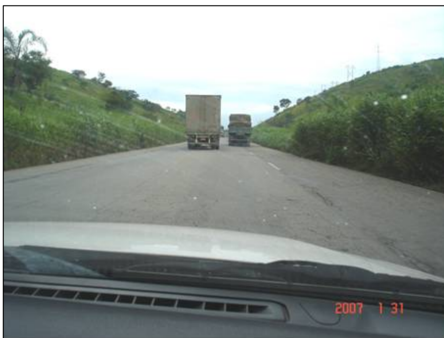
Figura 16. Próximo do km 323,0.