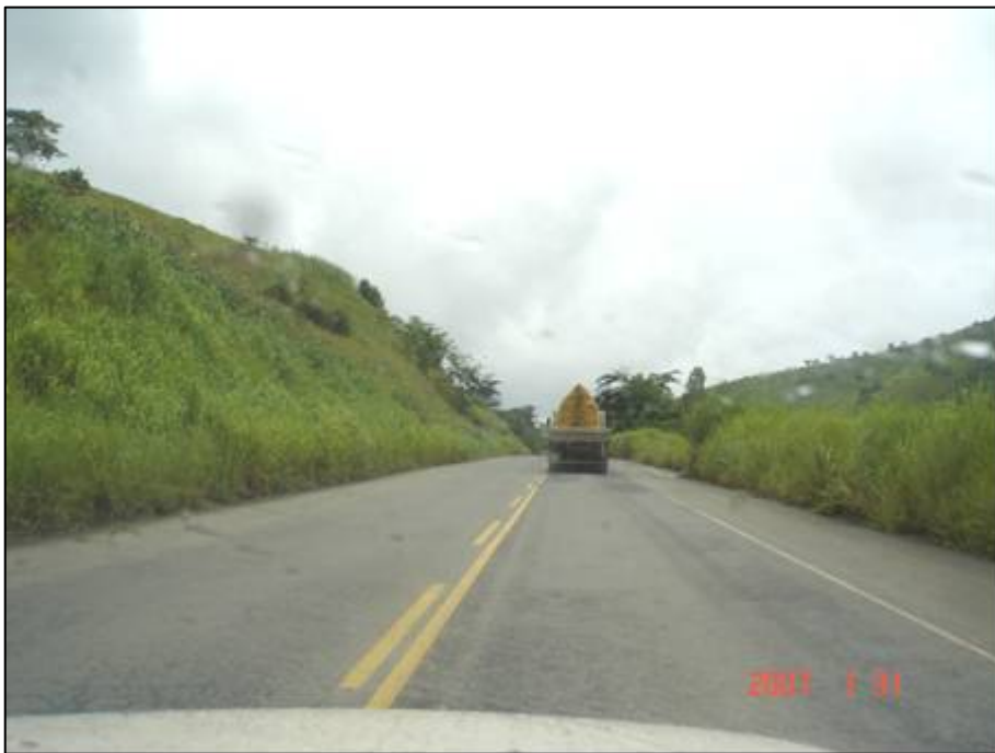
Figura 40. Próximo do km 491,0.