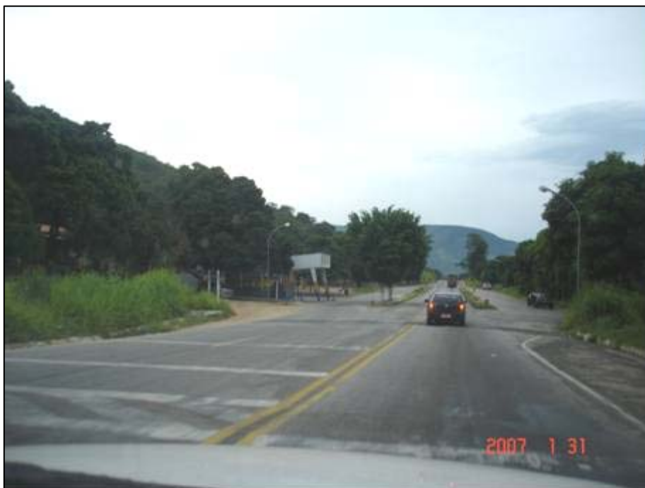
Figura 2. Próximo do km 118,0.