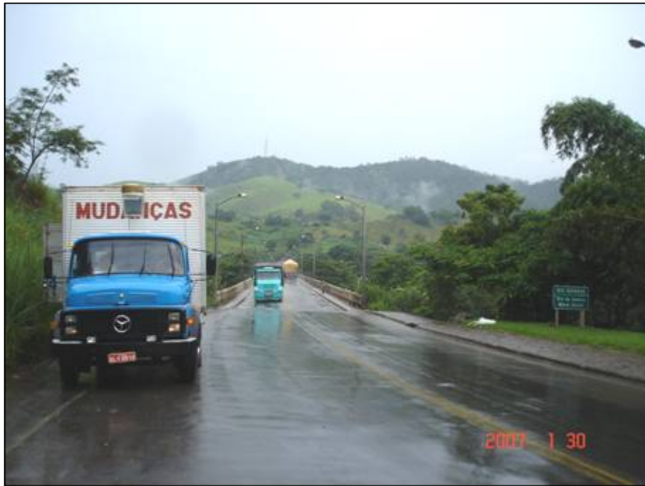
Figura 75. km 816,7 Div. RJ/MG.