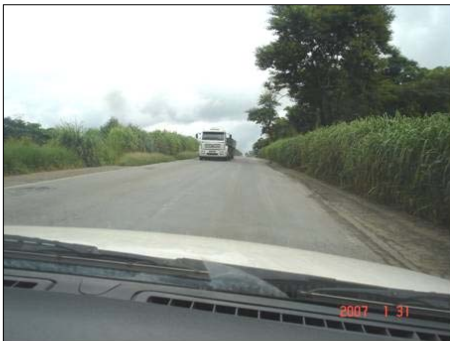
Figura 53. Próximo do km 601,0.