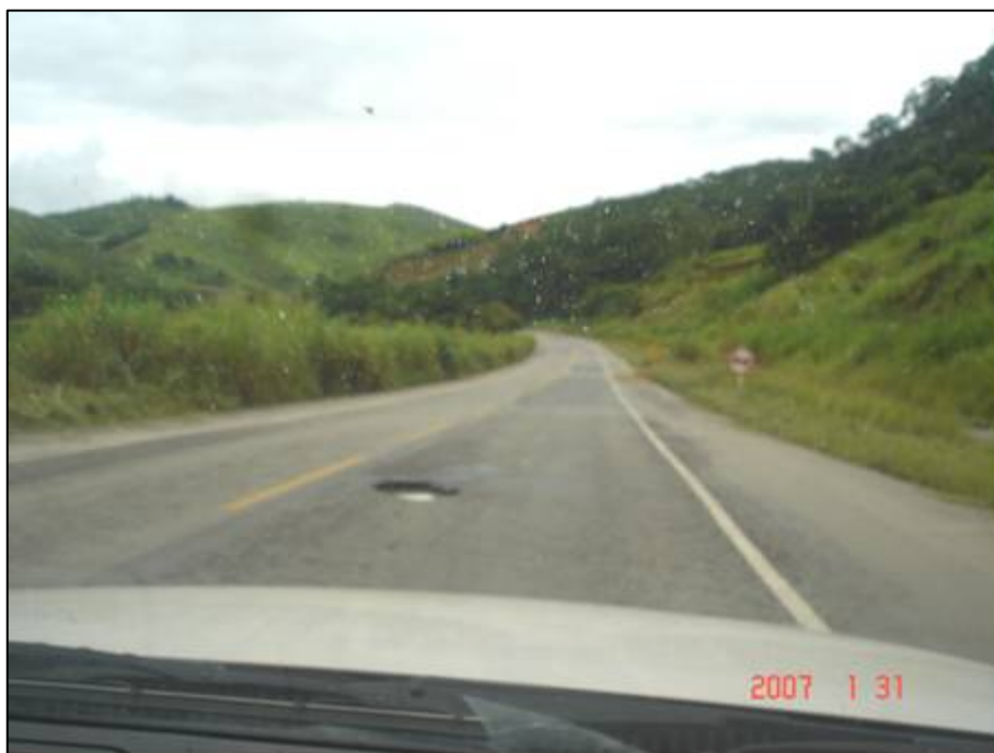
Figura 63. Próximo do km 669,0.