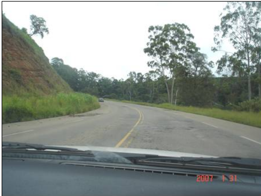
Figura 47. Próximo do km 585,0.