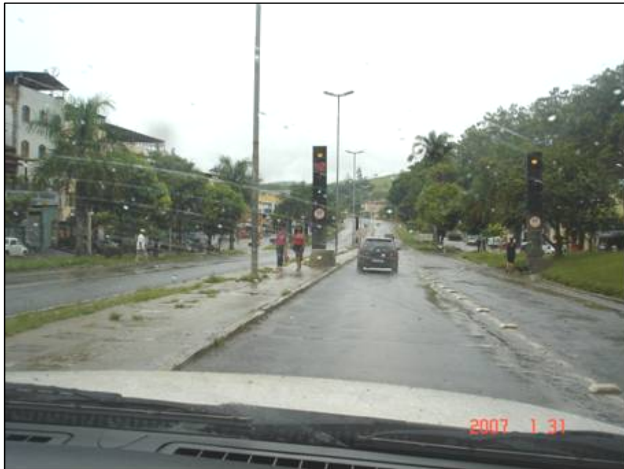
Figura 41. Próximo do km 526,5.