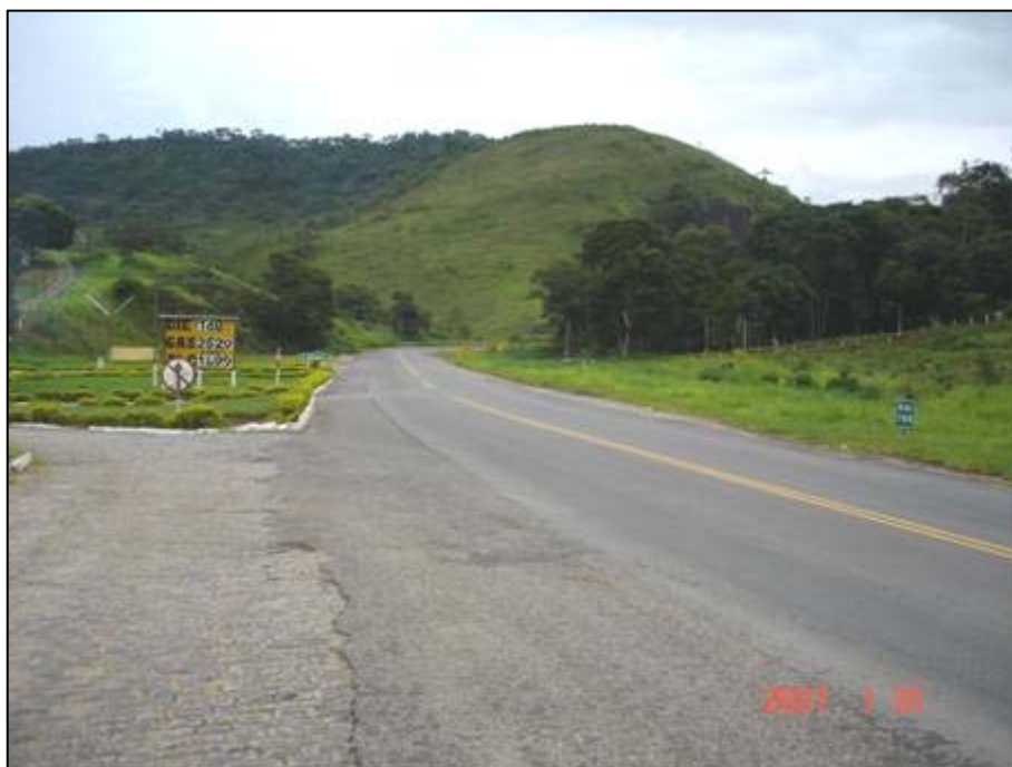
Figura 73. Próximo do km 784,0.