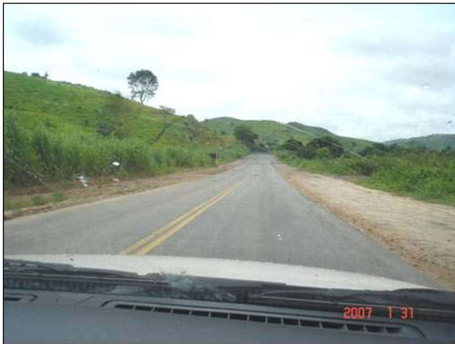
Figura 33. Próximo do km 445,5.