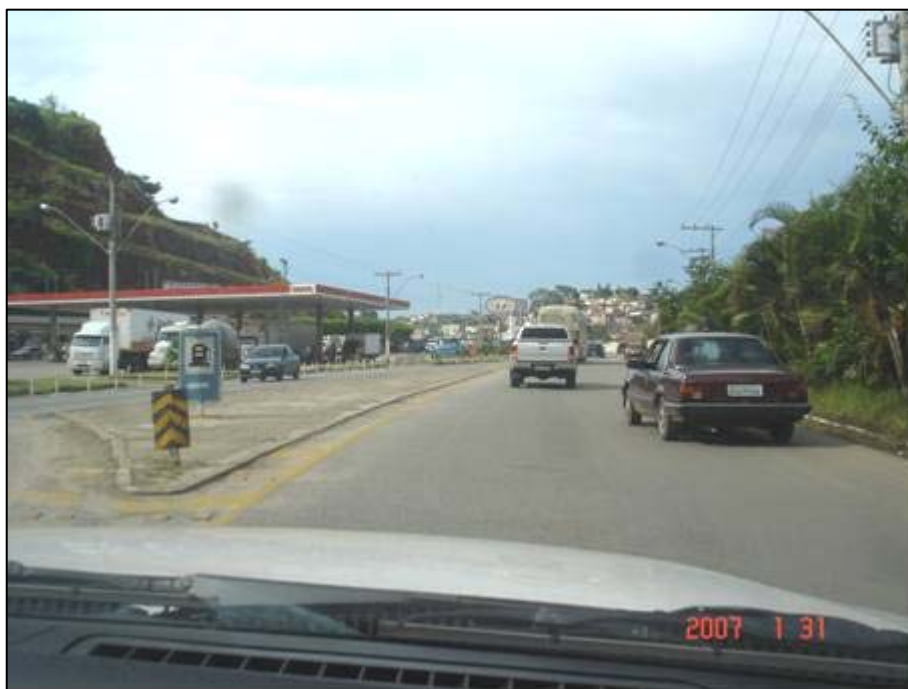
Figura 12. Próximo do km 278,0.