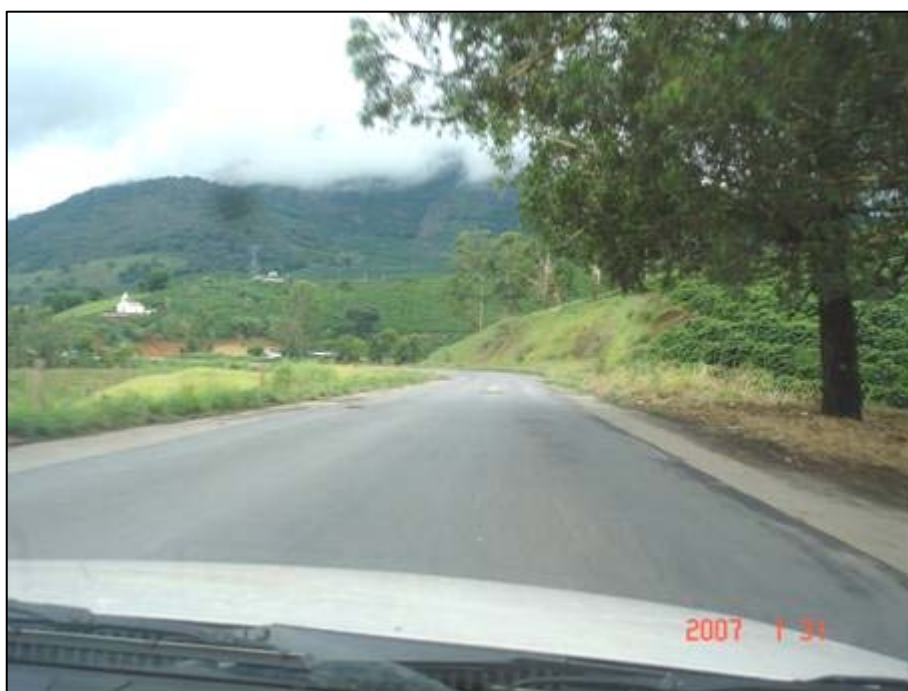
Figura 52. Próximo do km 600,0.