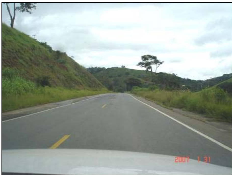
Figura 56. Próximo do km 646,0.