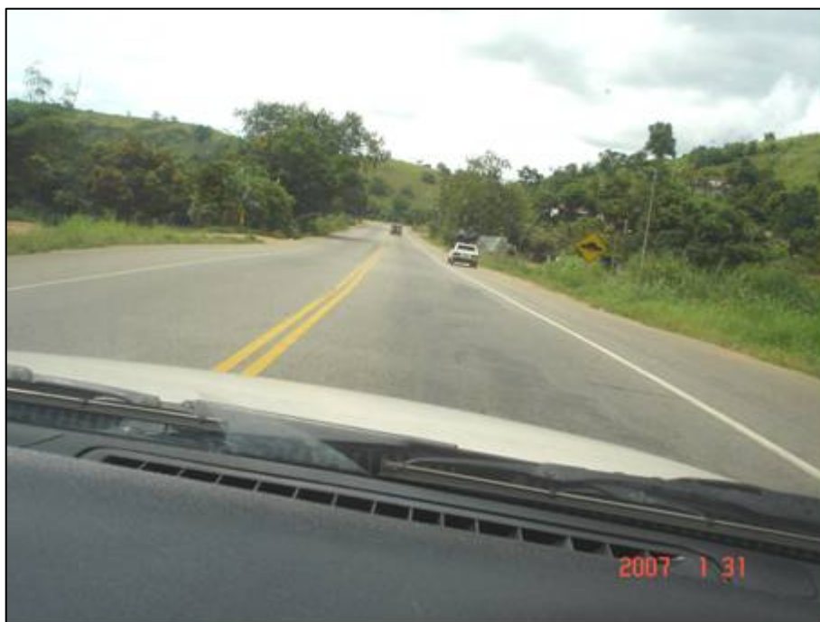
Figura 22. Próximo do km 374,0.