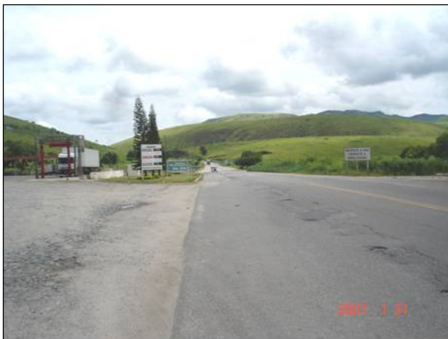
Figura 25. Próximo do km 394,0.