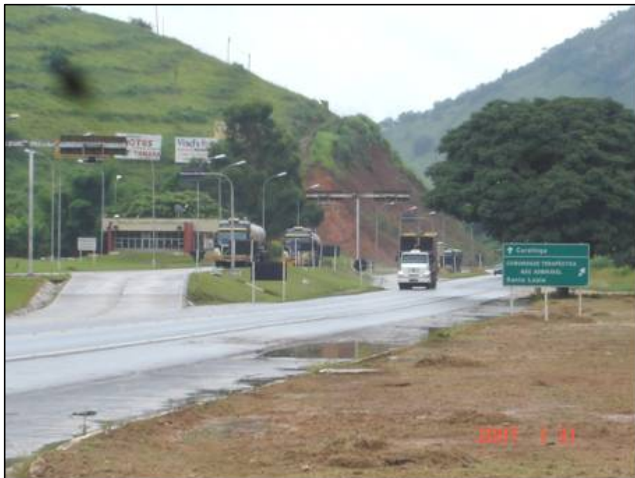
Figura 42. Próximo do km 531,0.