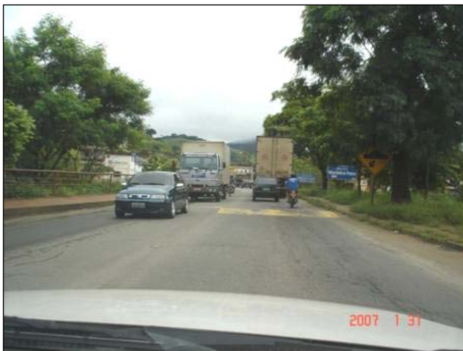
Figura 67. Próximo do km 704,0.