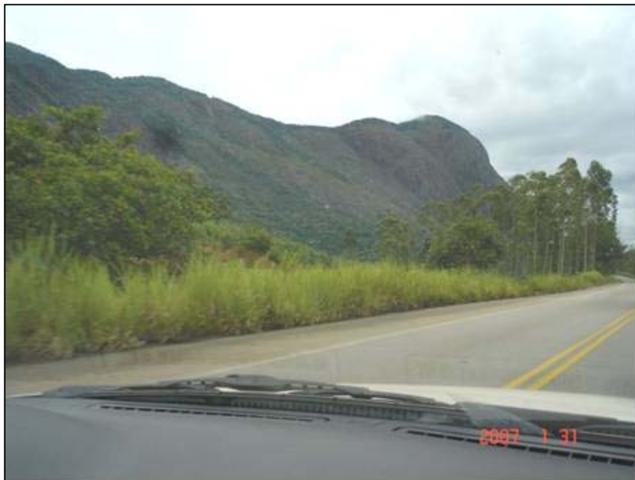
Figura 7. Próximo do km 214,0.