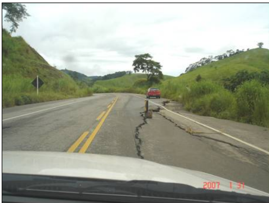
Figura 65. Próximo do km 679,0.