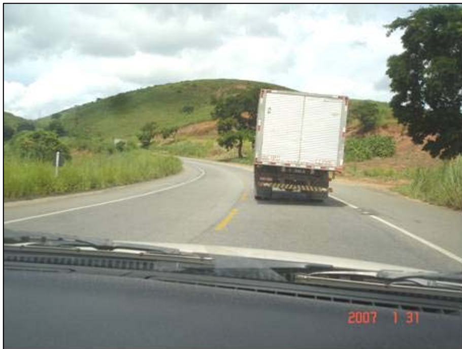
Figura 23. Próximo do km 379,0.