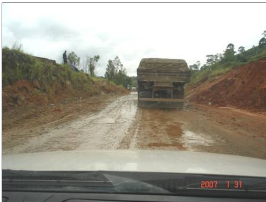
Figura 59. Próximo do km 664,0.