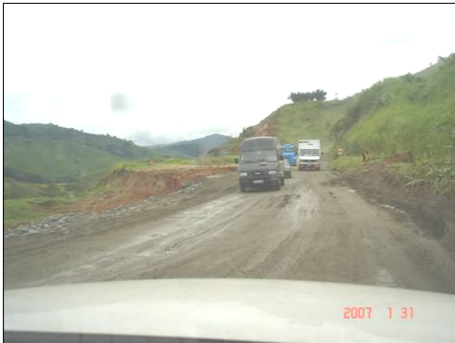
Figura 61. Próximo do km 666,5.