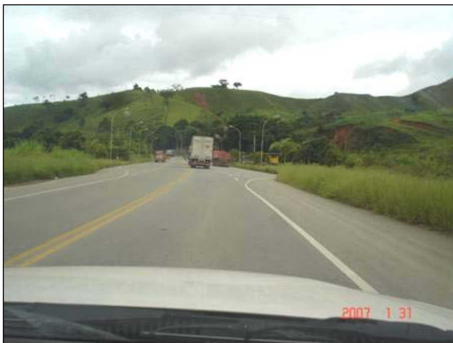
Figura 57. Próximo do km 654,0.