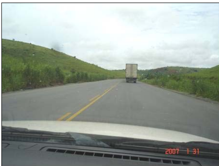
Figura 32. Próximo do km 438,0.