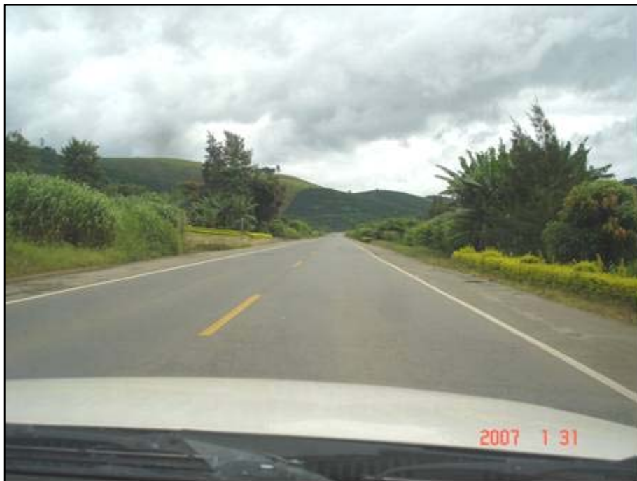
Figura 55. Próximo do km 626,0.