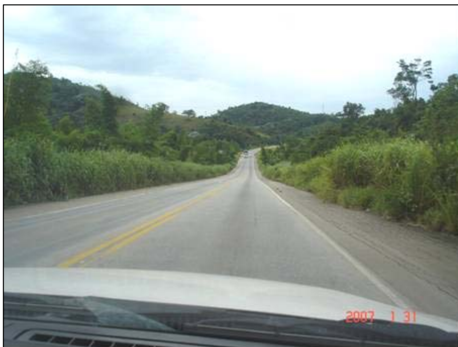
Figura 9. Próximo do km 265,0.