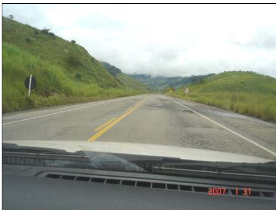
Figura 64. Próximo do km 678,0.