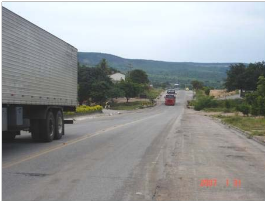
Figura 3. Próximo do km 137,0.