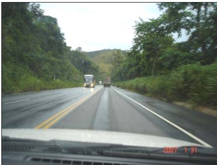
Figura 6. Próximo do km 197,0.