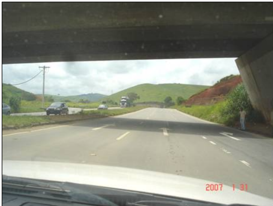
Figura 27. Próximo do km 409,0