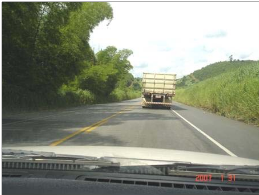
Figura 19. Próximo do km 350,0.