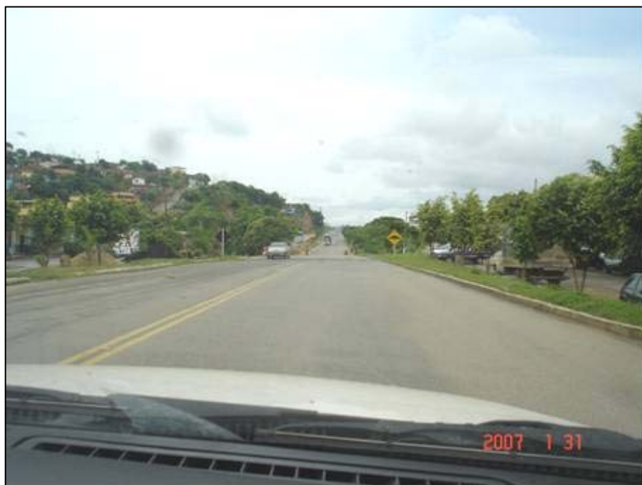
Figura 36. Próximo do km 455,5.