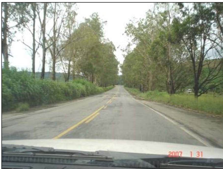
Figura 51. Próximo do km 599,0.