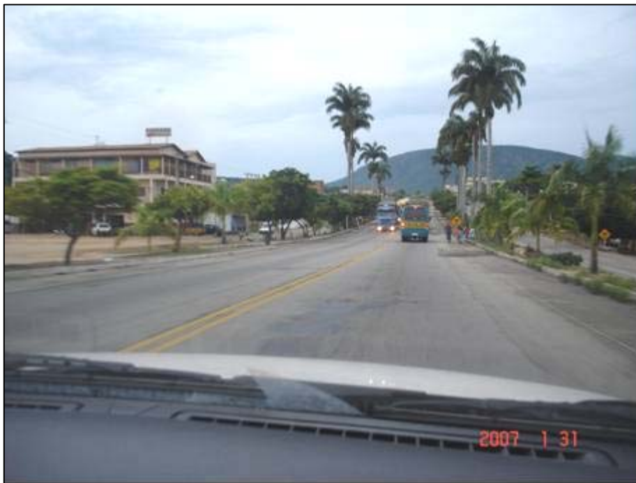
Figura 1. km 116,0, Perímetro Urbano Itaobim.