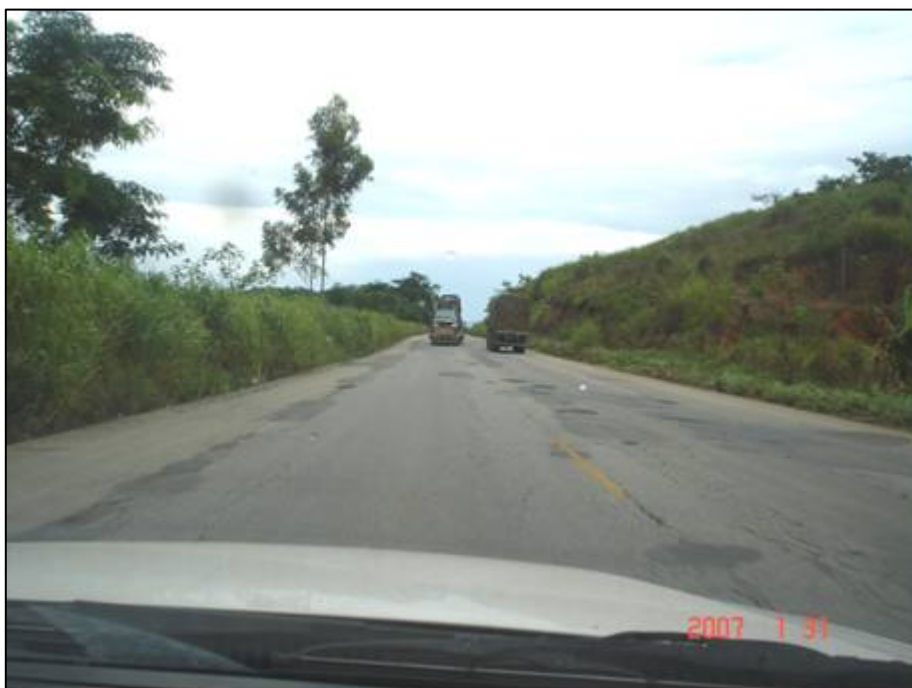
Figura 17. Próximo do km 325,0.