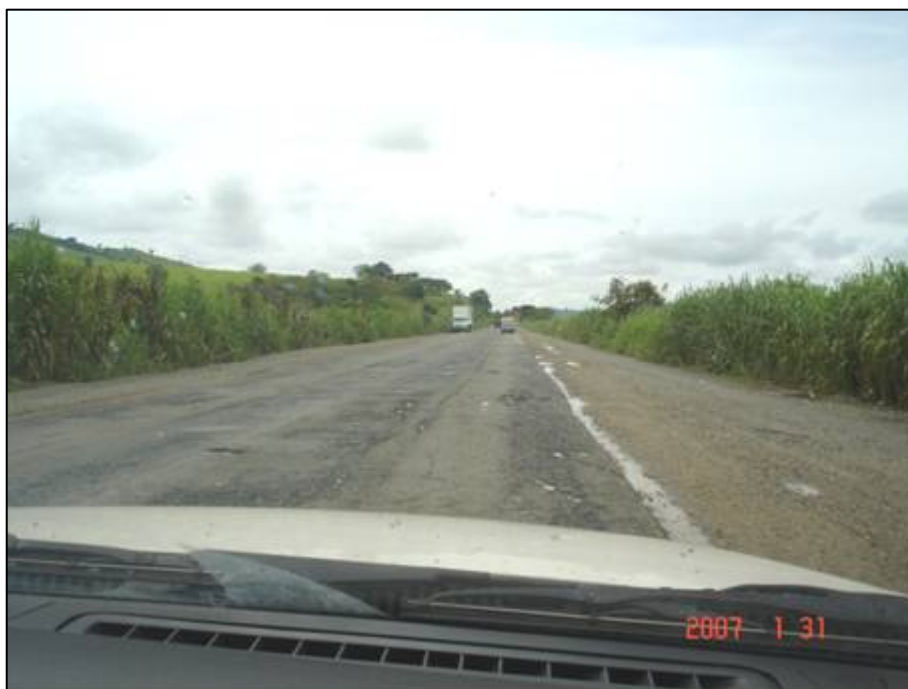
Figura 34. Próximo do km 450,0.