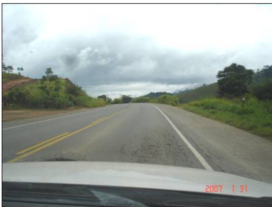
Figura 54. Próximo do km 604,0.