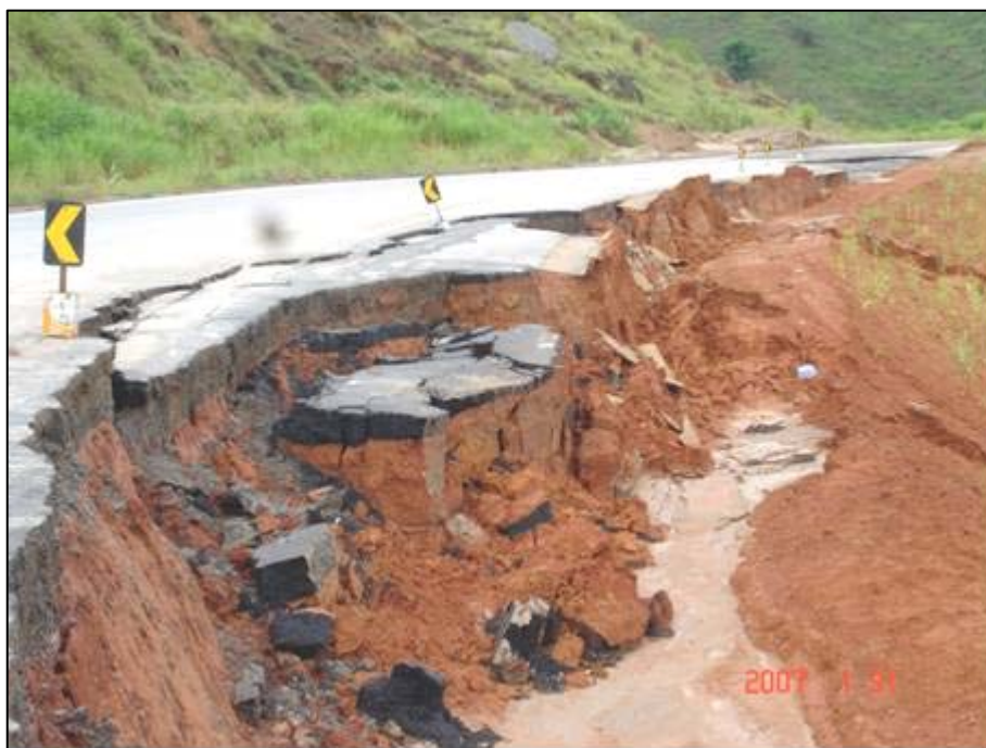
Figura 62. Próximo do km 667,0.