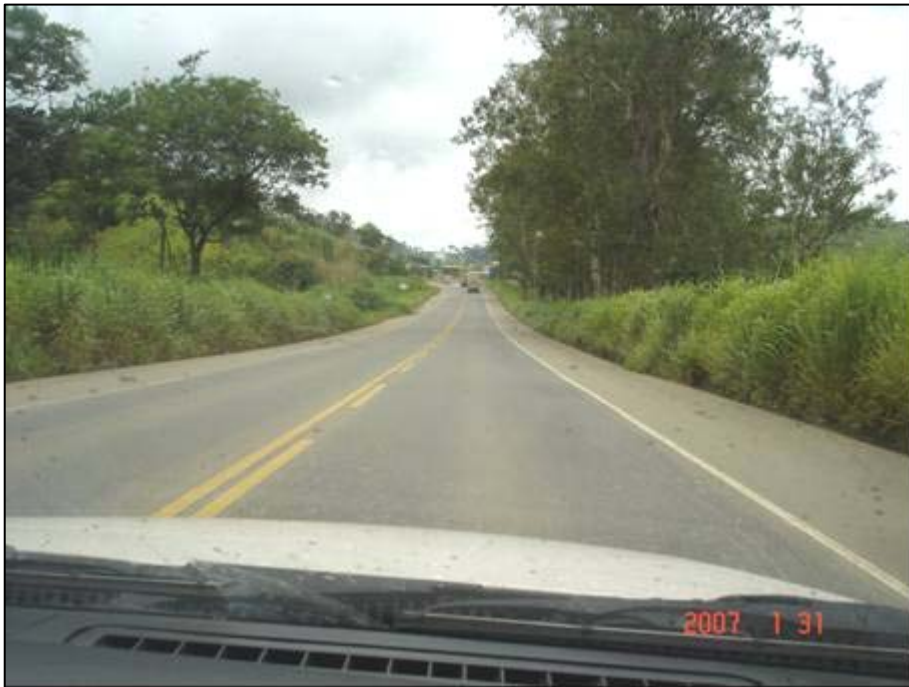
Figura 39. Próximo do km 479,5.