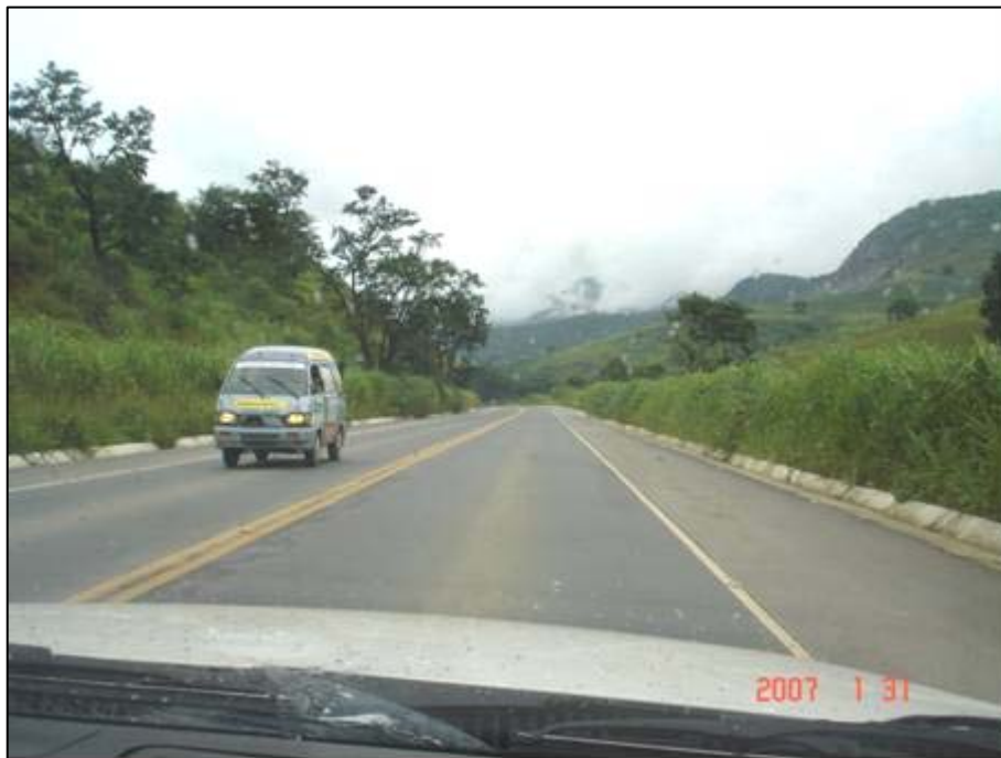
Figura 43. Próximo do km 534,0.