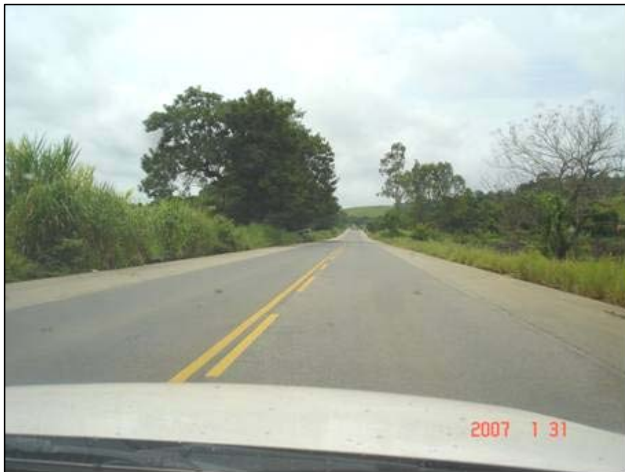
Figura 37. Próximo do km 463,0.