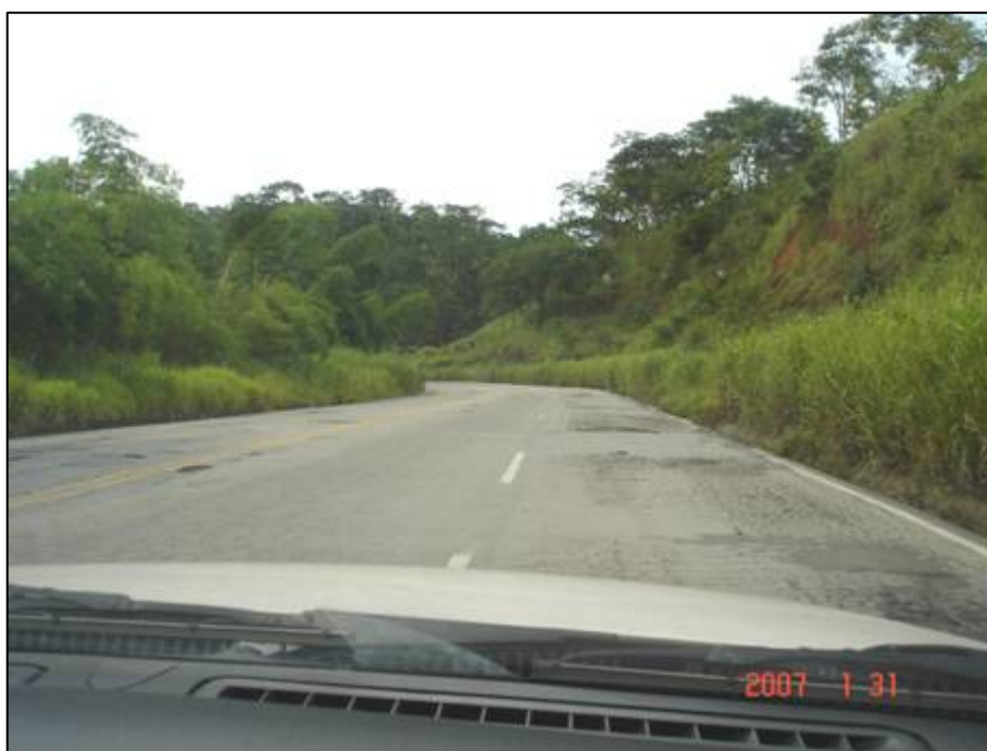
Figura 10. Próximo do km 268,0.