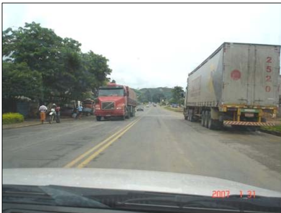
Figura 44. Próximo do km 538,0.