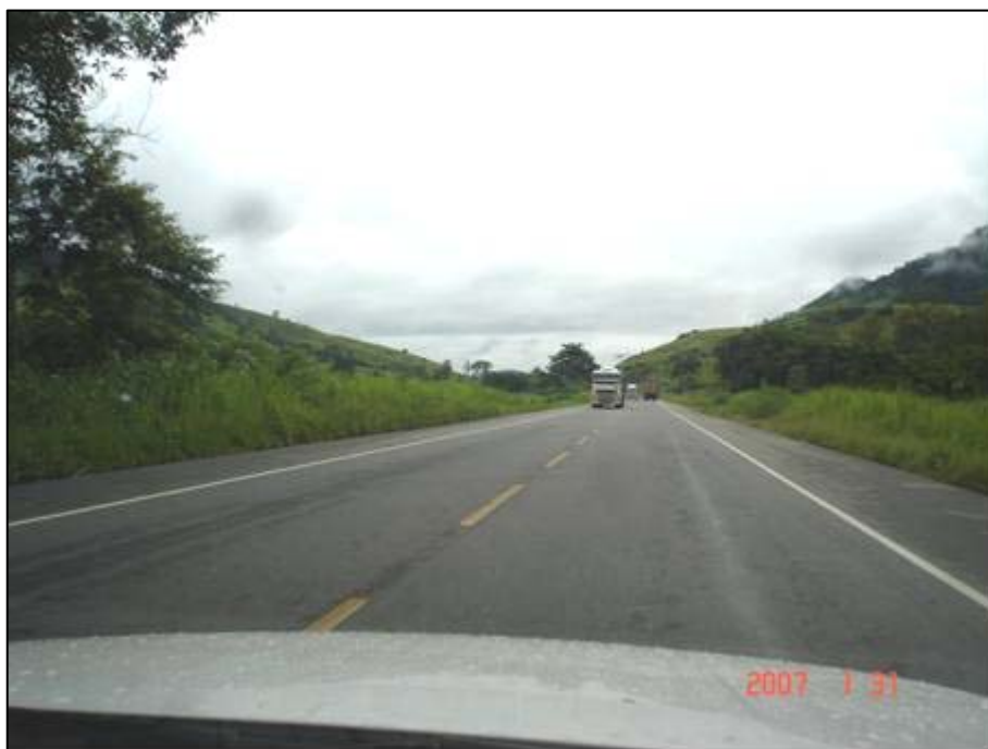
Figura 69. Próximo do km 731,0.