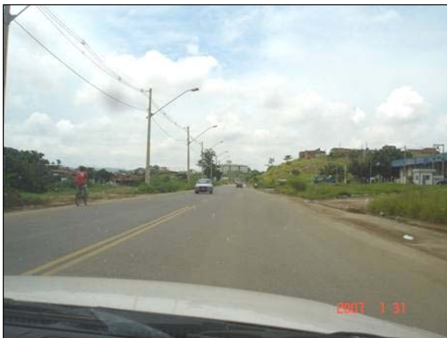
Figura 28. Próximo do km 417,0.