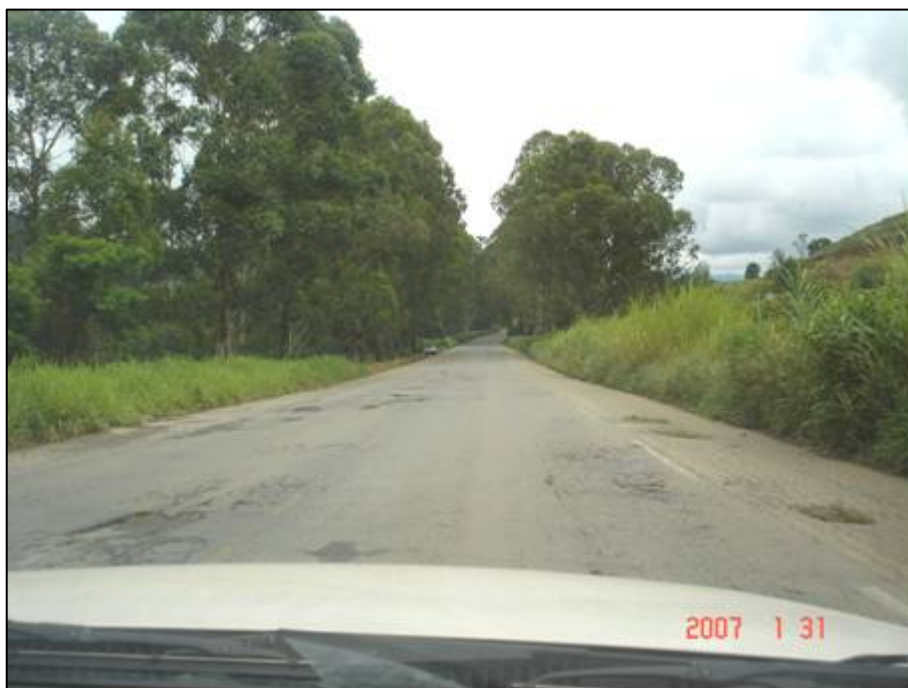
Figura 45. Próximo do km 538,5.