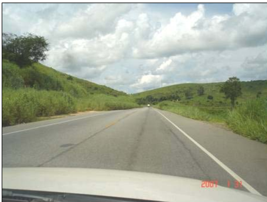
Figura 24. Próximo do km 383,0.