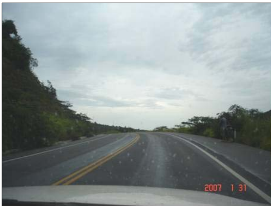
Figura 4. Próximo do km 164,0.