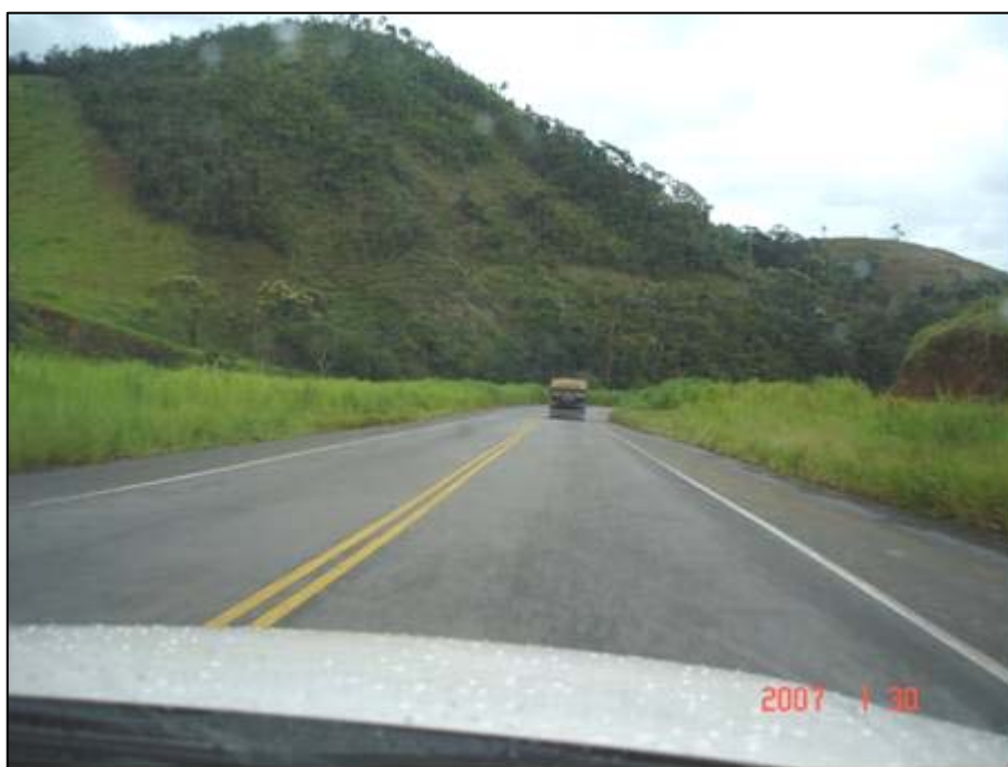
Figura 74. Próximo do km 787,0.