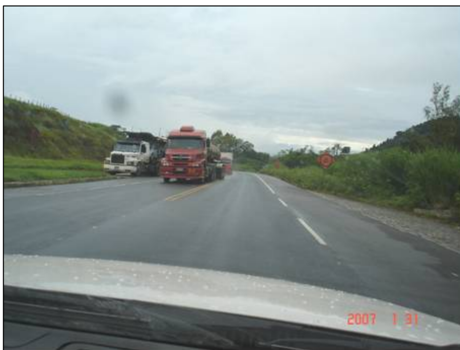
Figura 70. Próximo do km 759,0.