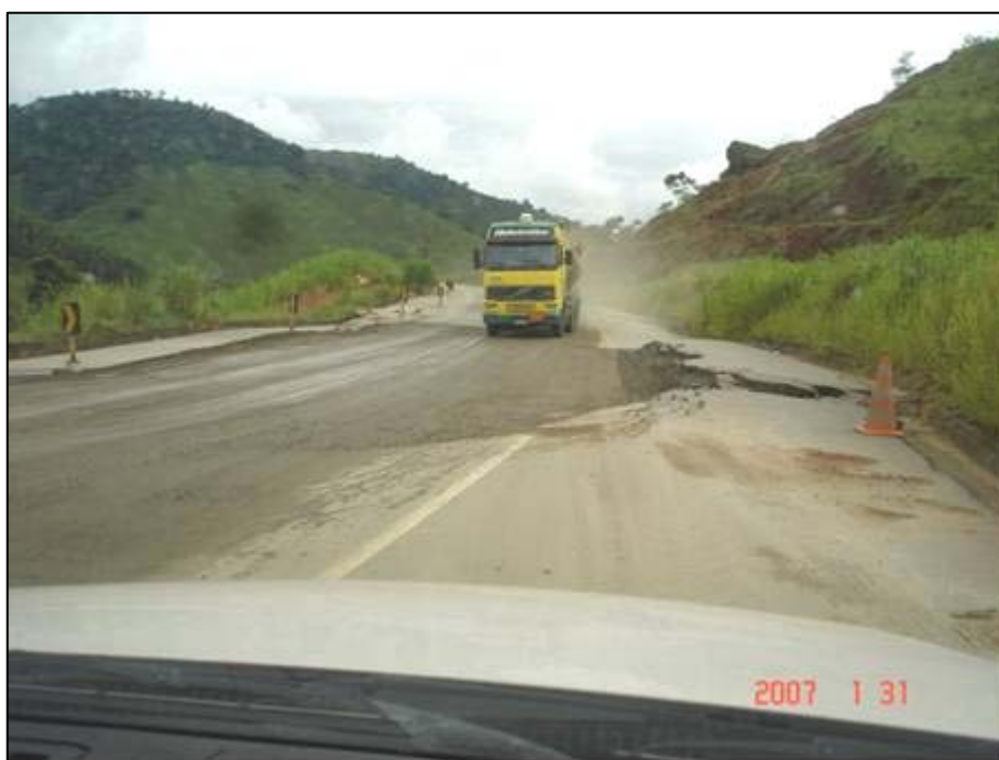
Figura 60. Próximo do km 666,0.