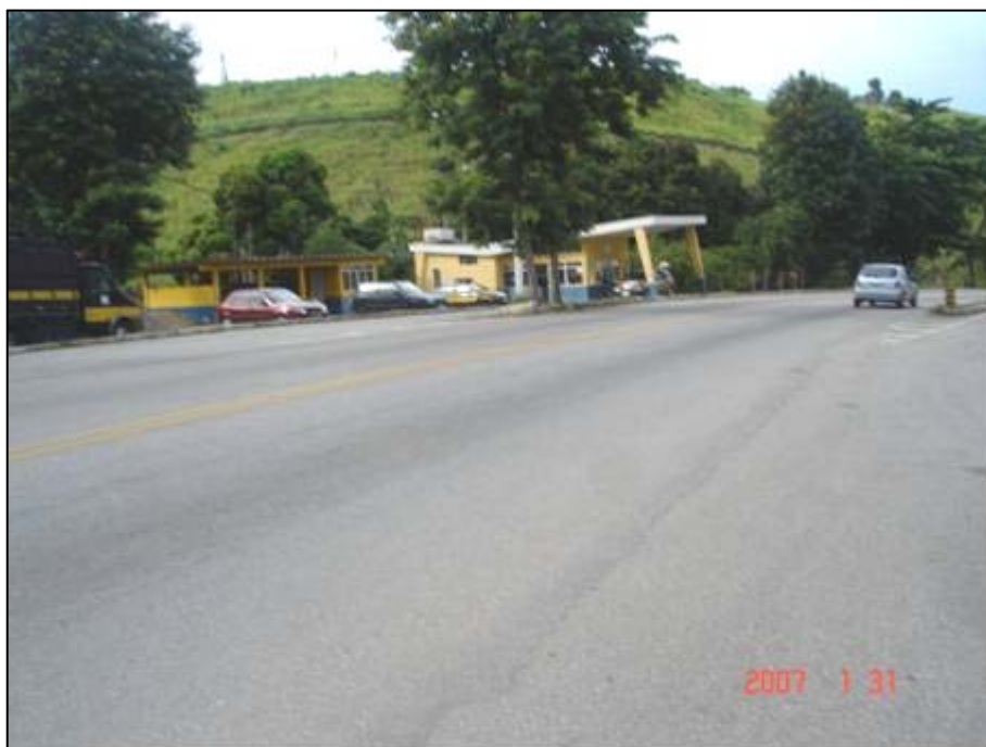
Figura 13. Próximo do km 279,0.