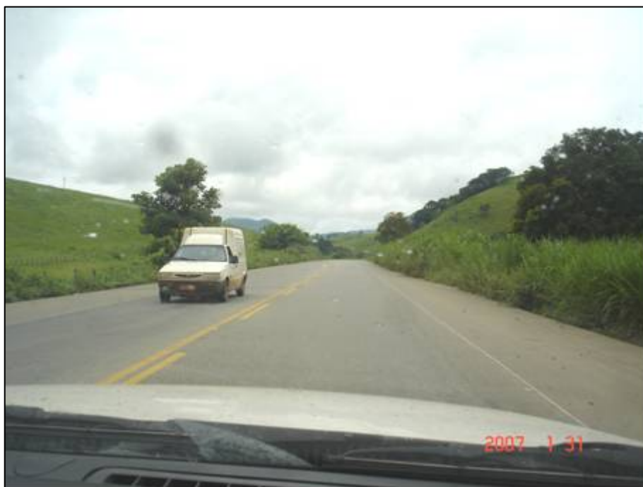
Figura 38. Próximo do km 476,0.