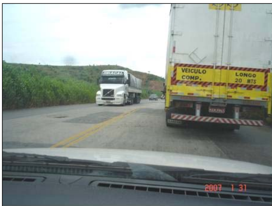
Figura 18. Próximo do km 327,0.