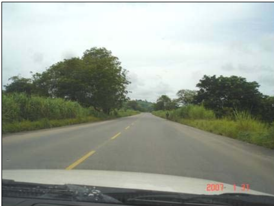
Figura 35. Próximo do km 453,5.