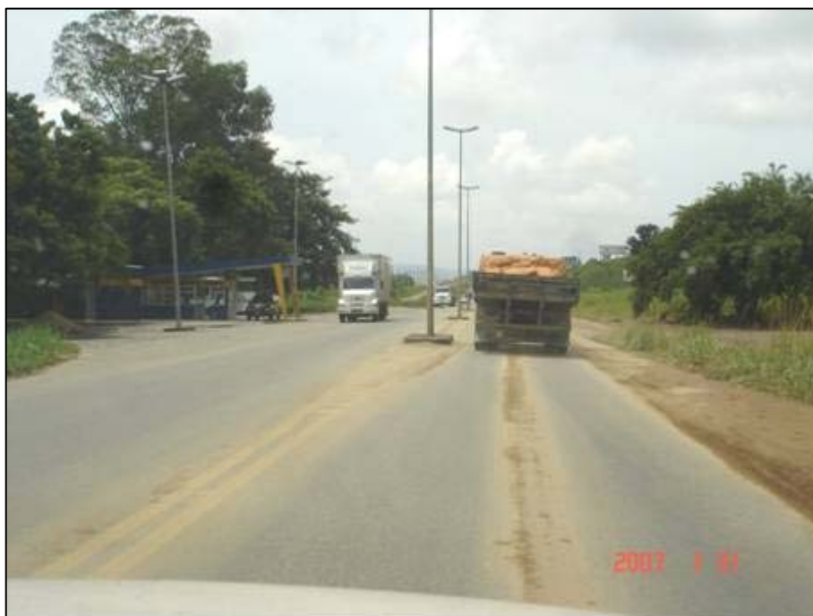
Figura 31. Próximo do km 419,0.