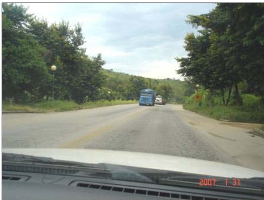
Figura 8. Próximo do km 245,0.