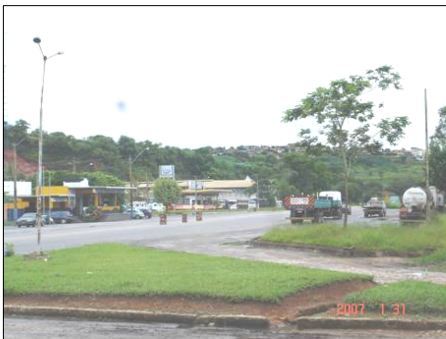
Figura 68. Próximo do km 707,0.