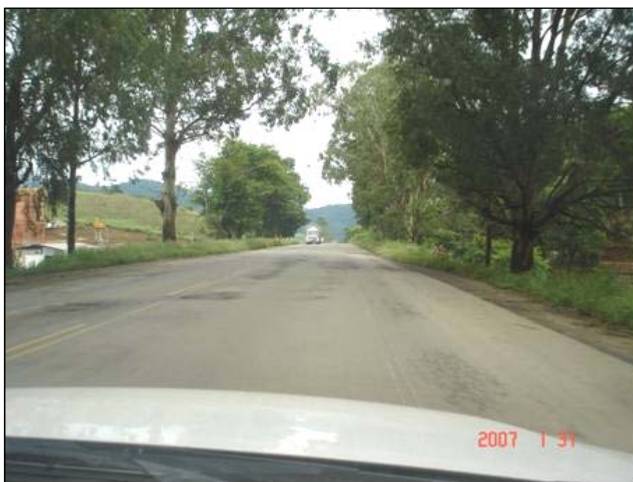
Figura 46. Próximo do km 585,0.