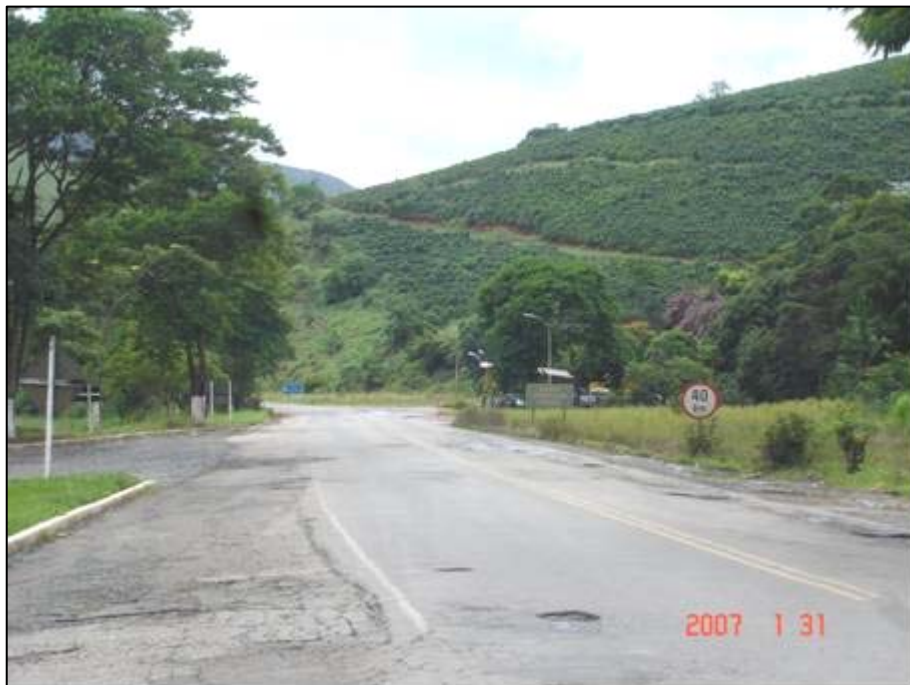
Figura 49. Próximo do km 590,0 A.