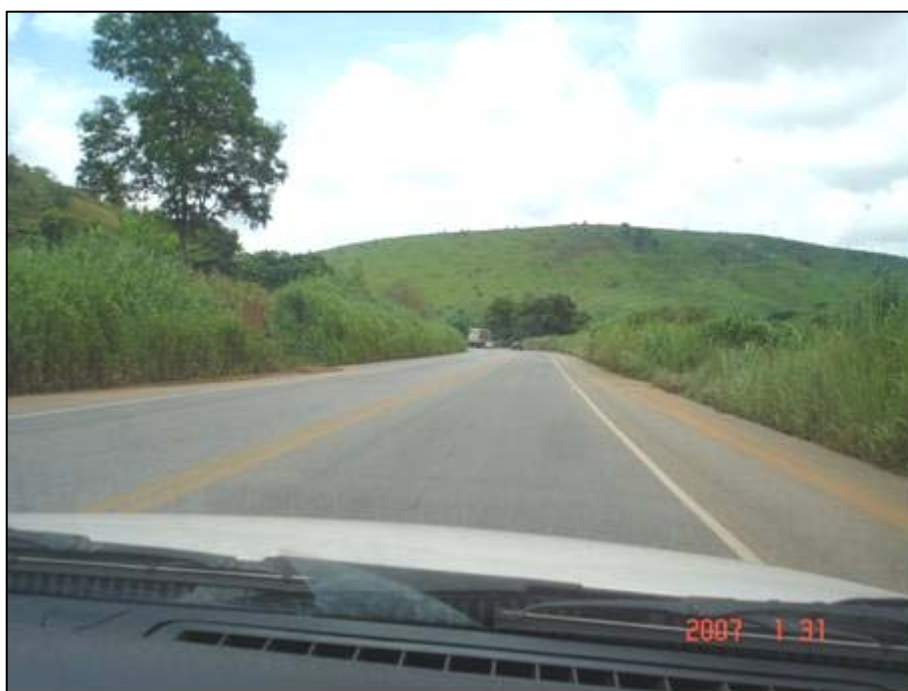
Figura 26. Próximo do km 404,0.