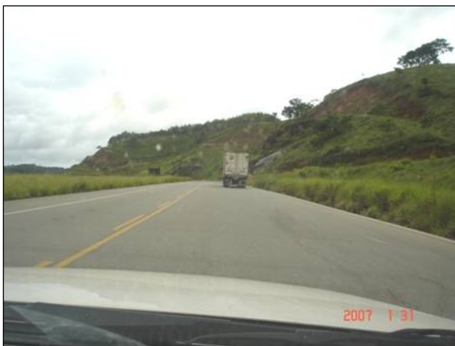
Figura 58. Próximo do km 661,0.