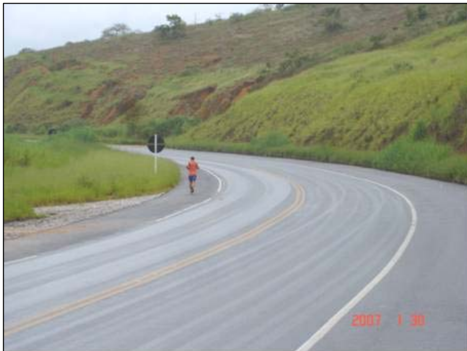
Figura 71. Próximo do km 768,0.