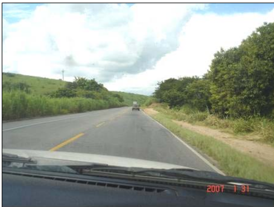
Figura 20. Próximo do km 358,5.