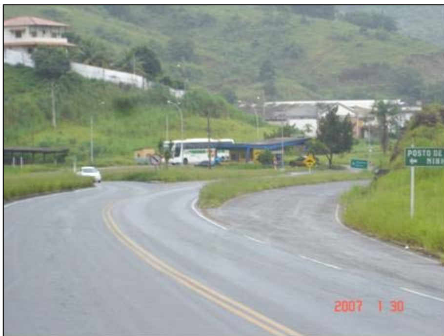
Figura 72. Próximo do km 769,0.