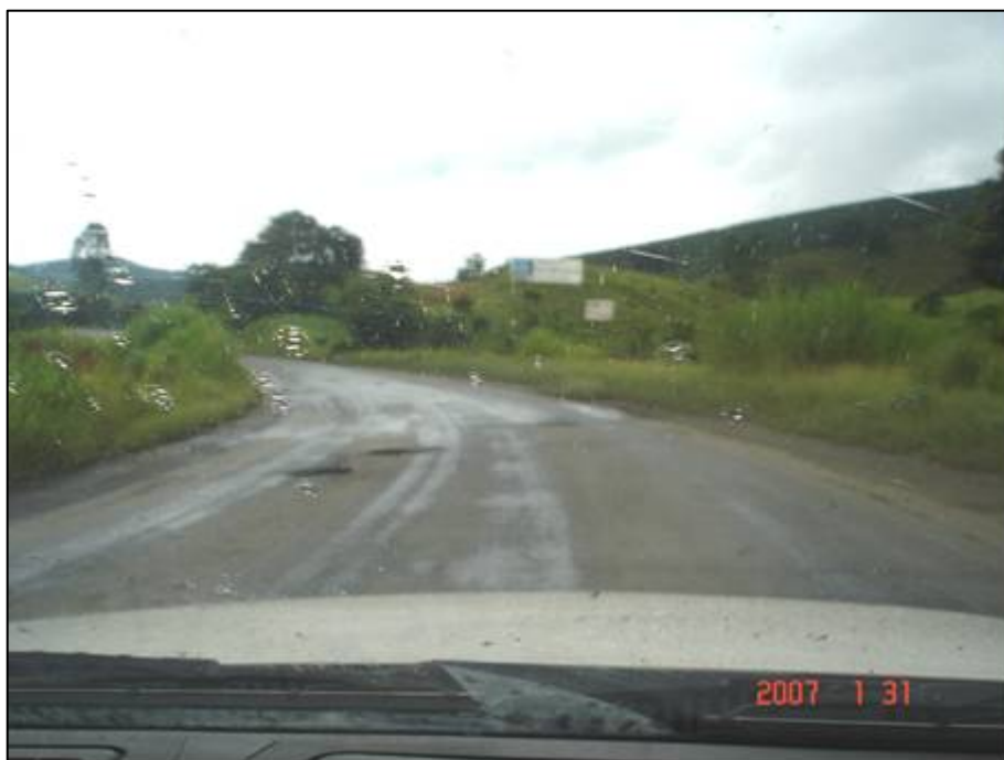
Figura 50. Próximo do km 595,5.