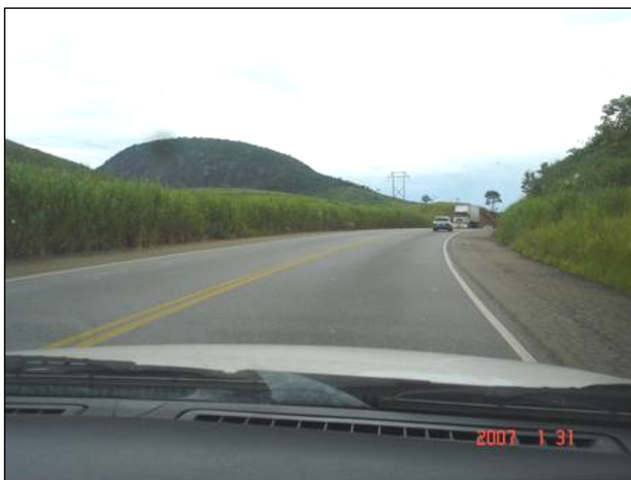
Figura 14. Próximo do km 298,5.