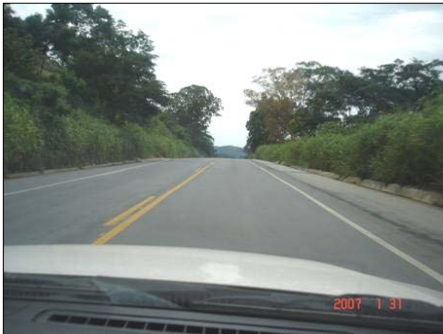
Figura 5. Próximo do km 187,0.