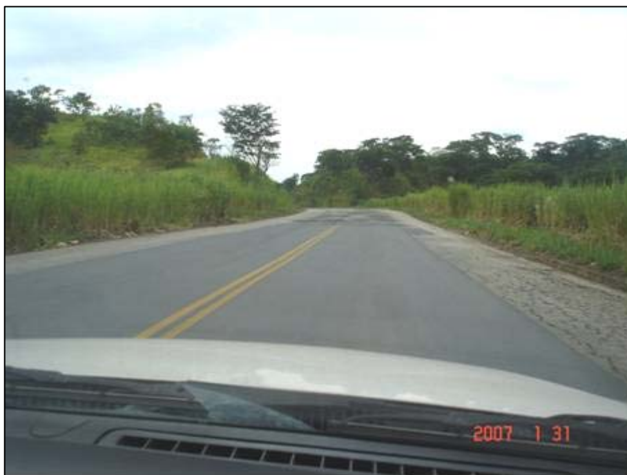
Figura 15. Próximo do km 309,0.