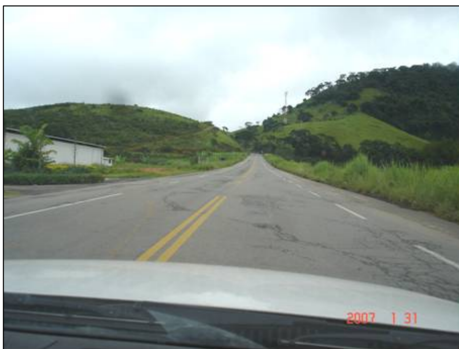
Figura 66. Próximo do km 701,0.