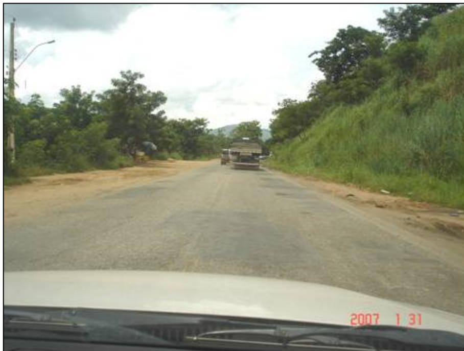
Figura 21. Próximo do km 369,0.