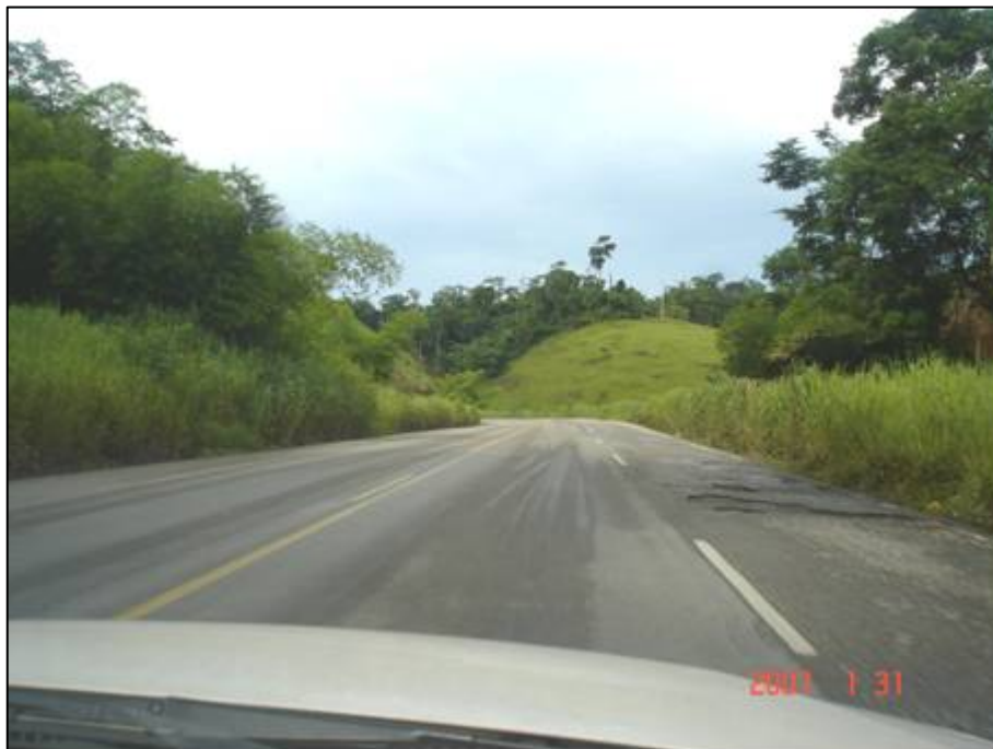
Figura 11. Próximo do km 272,0.