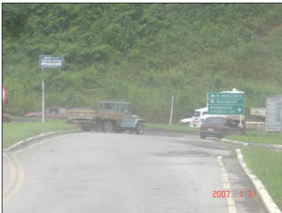
Figura 48. Próximo do km 590,0.